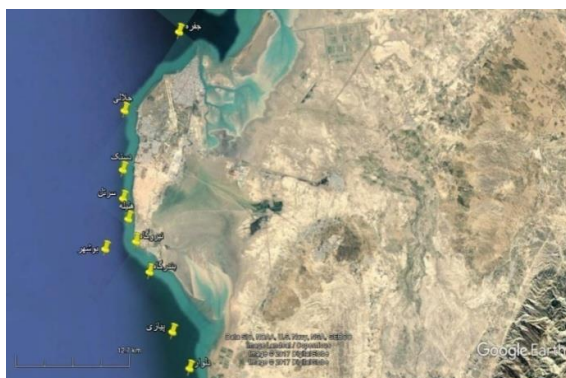
شکل ۱: نقشه منطقه و موقعیت ایستگاه های مورد بررسی Figure 1: Map of the studied region and sampling stations

and Richardson, 1977). انجام شد. در آزمایشگاه کلیه نمونه ها به کمک کلیدهای معتبر از جمله (Todd and Laverack, 1991; Smith and Johnson, 1996; Chihara and Murano, 1997; Al-Yamani et al. , 2011) و با استفاده از میکروسکوپ اینورت نیکون مدل Ti-S شناسایی و شمارش گردیدند.