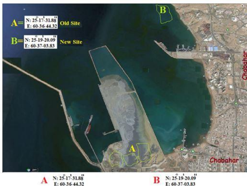
شکل ۳: موقعیت مرجان‌های محصور شده در نقطه A نسبت به سایت جدید نقطه B Figure 3: Position of the corals enclosed at point A relative to the new site point B