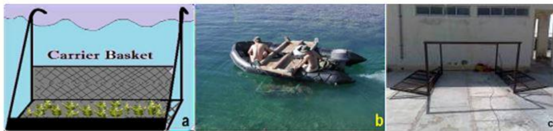
شکل ۲: سبد قدیمی انتقال مرجان (a و b) اقتباس از هاوایی (Carrier Basket) (Paul et al., 2005) و ساخته شده توسط کارشناسان موسسه تحقیقات علوم شیلاتی کشور در مرکز تحقیقات شیلاتی چابهار (c)