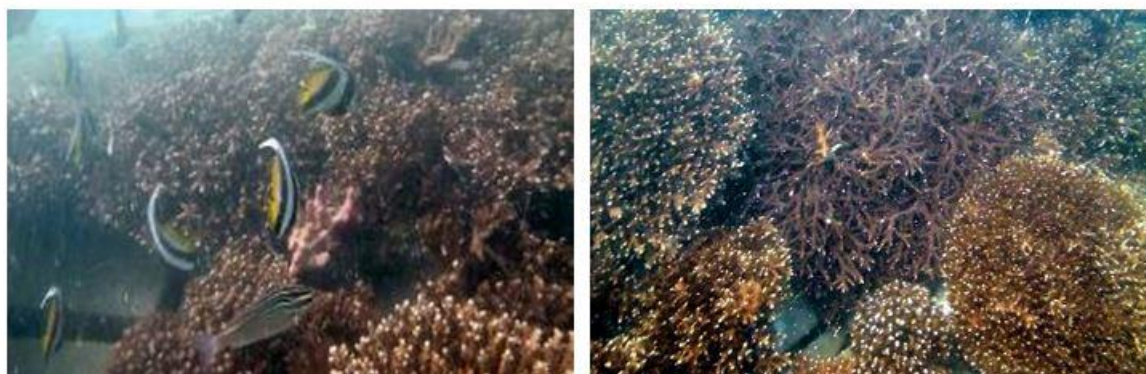
شکل ۷: تصاویری از پایش سایت مرجان ها در خلیج چابهار