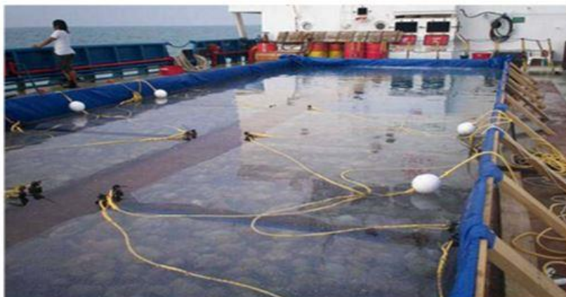
شکل ۱: انتقال مرجان ها در محفظه های آبی و ایجاد حوضچه در عرشه کشتی (Kilbane et al., 2008) Figure 1: The transfer of corals in water chambers and the creation of ponds on the deck (Kilbane et al., 2008)