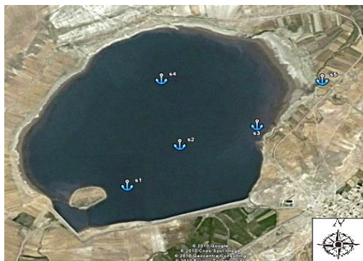
شکل ۱: ایستگاه‌های دریاچه سد مخزنی اردلان

این پژوهش ارزیابی خصوصیات زیستی و غیر زیستی دریاچه و اقلیم منطقه به‌منظور امکان دستیابی به تولیدی مطلوب‌تر بود.