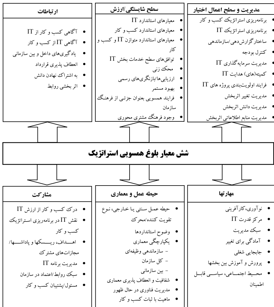
شکل ۲- مدل ارتقاء یافته بلوغ همسویی لوفتمن (مدل نهایی مورد استفاده در تحقیق)