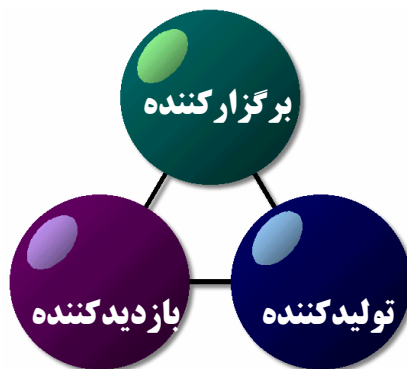
نمودار ۱- عوامل اصلی و حیاتی شکل‌گیری نمایشگاه

برگزارکننده نمایشگاه، غرفه‌دار و بازدیدکننده هر کدام نقشی اصلی و حیاتی در این فعالیت بازاریابی دارند و محقق شدن اهداف هر یک در گرو تحقق اهداف سایرین است. نمودار (۱) ارتباط سه گروه را نشان می‌دهد: