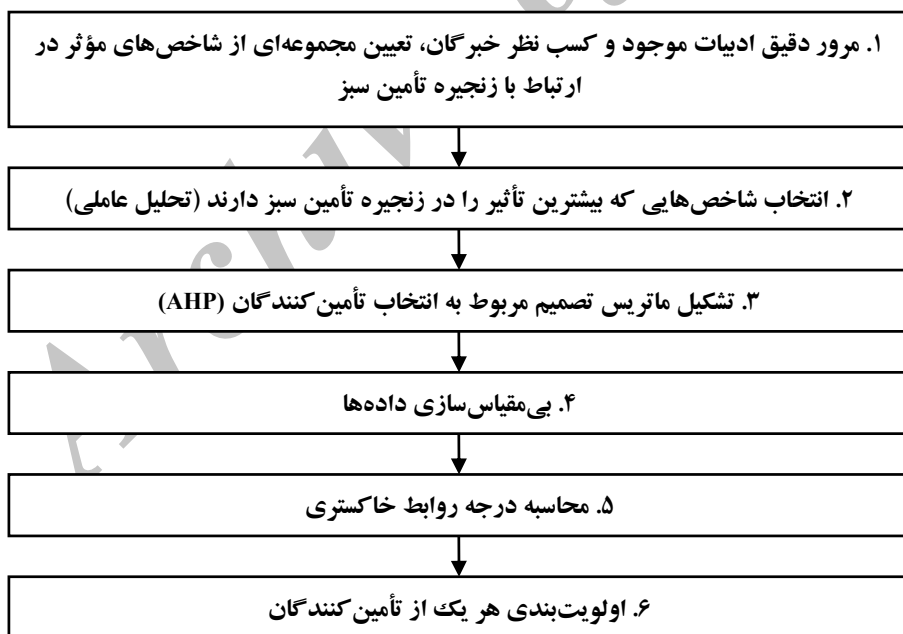
شکل ۱- مراحل اجرای تحقیق

از آنجا که هدف این مقاله ارائه مدلی برای سنجش مدیریت زنجیره تأمین سبز و رتبه‌بندی تأمین‌کنندگان است، ابتدا با مطالعه و بررسی متون علمی، ادبیات تحقیق تدوین شده، سپس اطلاعات لازم در مورد شرکت فولاد آلیاژی ایران جمع‌آوری گردیده است. با توجه به ادبیات تحقیق و اطلاعات در مورد شرکت، شاخص‌های زنجیره تأمین سبز استخراج شده است. این شاخص‌ها مبنای تهیه پرسش‌نامه قرار گرفته و پس از جمع‌آوری داده‌ها تحلیل عاملی اکتشافی انجام شده است، سپس به کمک نرم‌افزار لیزرل تحلیل عاملی تاییدی صورت گرفته و مدل نهایی تدوین شده و این شاخص‌های اصلی، در انتخاب تأمین‌کنندگان مورد استفاده قرار گرفتند. شکل (۱)، فرآیند اجرای پژوهش را نشان می‌دهد.