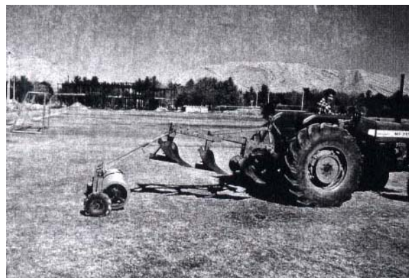
شکل ۲- غلتک خاک نشان در حالت راهپیمایی

حامل از زمین فاصله گرفته و مجموعه غلتک‌ها به دنبال گاوآهن کار کلوخ شکنی و تثبیت خاک شخم خورده را آغاز می‌نمایند. غلتک خاک شکن به فاصله حدود یک متر در پشت گاوآهن و همراستا با آن حرکت می‌نماید تا از اعمال نیروی جانبی یا خارج از محور به دستگاه گاوآهن جلوگیری شده و کلوخه‌های حاصل از شخم بلافاصله قبل از دست دادن رطوبت توسط دیسک‌های غلتک خرد گردند.