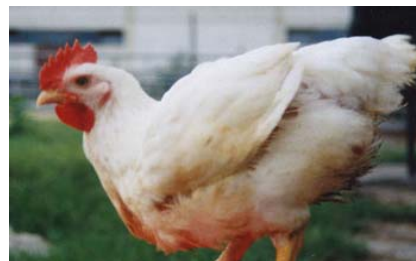
شکل ۲- فنوتیپ خروس های تولید شده از تخم مرغ های تیمار شده با آنتی آروماتاز