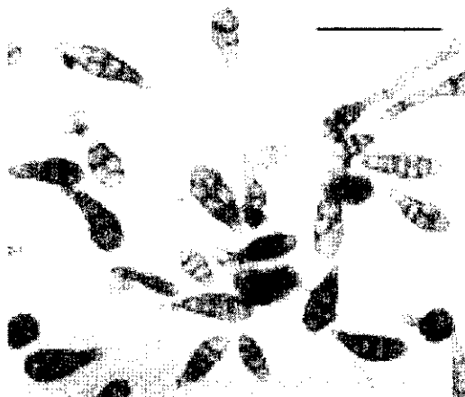
شکل ۱ مشخصات میکروسکوپی قارچ Alternaria alternata الف- برگه قارچ روی محیط PDA ب- شکل کنیدی ج- زنجیر کنیدی روی محیط آب آگار.