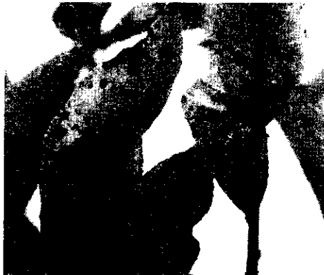
شکل ۴- علائم بیماری روی سرشاخه‌های جوان نارنگی پیچ.