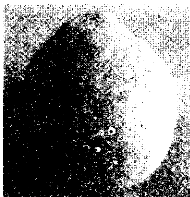
شکل ۳- علائم بیماری روی میوه الف- لکه قهوه‌ای با هاله کلروتیک ب- جوش‌های چوب پنبه‌ای شکل.