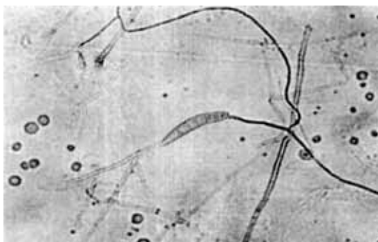
شکل ۴- کنیدی قارچ Bipolaris sp. در حال جوانه زدن از دو قطب با بزرگنمایی تقریبی ۲۳۰ برابر