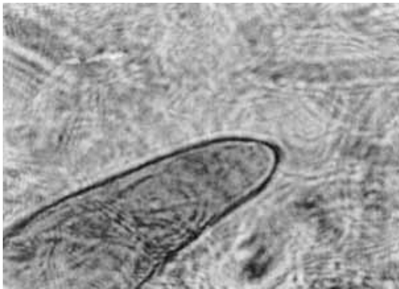
شکل ۲- هیلوم کنیدی قارچ B. oryzae با بزرگنمایی تقریبی ۱۲۰۰ برابر