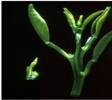
شکل ۱- منبع تهیه پیوندک.