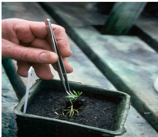
شکل ۴- انتقال گیاهان حاصل از پیوند نوک شاخه به خاک.

سپس عصاره مذکور در بافر رقیق شده و پس از طی مراحل مختلف آزمون الایزا، در صورت وجود آلودگی، تغییر رنگ درون چاهک‌های پلیت ۱ مشاهده خواهد شد که نمایانگر واکنش آنتی‌بادی و عصاره است که در واقع واکنش مثبت همان آلودگی به تریسترا تلقی می‌گردد (روستاگر، ۱۹۹۱).