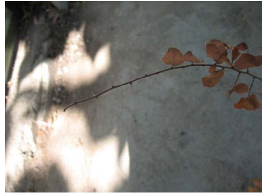
شکل ۲- علائم مختلف پژمردگی نهال‌های نارون چینی در اثر مایه‌زنی با عامل بیماری مرگ نارون.