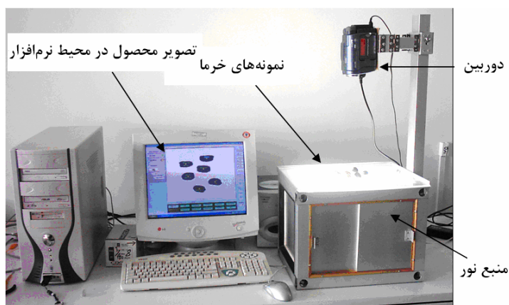
شکل ۲- دستگاه اندازه‌گیری ابعاد و مساحت سطوح تصویر شده.

جرم خرما با استفاده از ترازوی حساس دیجیتالی با دقت ۰/۰۱ گرم به دست آمد. برای تعیین و اندازه‌گیری حجم و چگالی هر دانه خرما از روش میزان آب جابه‌جا شده استفاده شد. بدین منظور با قرار دادن بشر محتوی آب روی ترازو و صفر کردن وزن آن، با غوطه‌ور کردن خرما در بشر جرم آب جابه‌جا شده (عدد خوانده شده روی ترازو) تعیین شد. با استفاده از معادله زیر چگالی هر دانه از خرما قابل محاسبه گردید (محسنین، ۱۹۸۶):