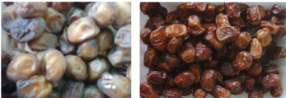
شکل ۱- ارقام خاصویی و برخی به ترتیب از راست به چپ.