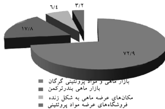
شکل ۱- محل تهیه فرآورده‌های شیلاتی.