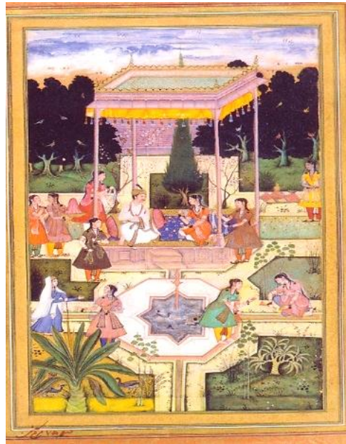
تصویر ۱. وجود عناصر نقاشی ایرانی در صفحه ۷۵ مرقع گلشن، مصورسازی در زمان پادشاهی اکبرشاه

هنرمندان پس از دو سال زندگی در قندهار به فرمان همایون‌شاه که فارغ از جنگ شدند و مجال آزاد داشتند، به هند دعوت شدند. پس از ورود آنان، همایون‌شاه ساختمان قلعه قدیمی در دهلی که در سه طبقه بود و امروزه در (پورناکیلا) دهلی هنوز هم استفاده می‌شود، را برای آنان مهیا ساخت (راجرز، ۱۳۸۲: ۵۱) و ریاست آن را به میرسیدعلی داده است (آژند، ۱۳۸۹: ۵۵۱). عبدالصمد نیز رئیس ضربخانه هند شد (راجرز، ۱۳۸۲: ۵۲). در توزک‌نامه جهانگیری به مشق تصویر شاهزاده اکبر در کابل زیر نظر عبدالصمد اشاره شد (جهانگیرگورکانی، ۱۳۵۹: ۱۸-۱۹). میرسیدعلی و عبدالصمد در سال ۹۶۲ ه.ق/ ۱۵۵۴ م در جوار همایون به هنگام تسخیر هند، وارد دهلی شدند. در این هنگام همایون‌شاه در محوطه قلعه کهنه دهلی کتابخانه‌ای ایجاد کرد (غروی، ۱۳۸۵: ۳۸) و اسباب آسایش آنان را مهیا ساخت. همایون‌شاه اسباب و لوازم نگارگری را برای آن‌ها فراهم کرد و برای تشویق آنان شاه اغلب از این کتابخانه بازدید می‌کرد (کریم‌زاده تبریزی، ۱۳۶۳: ۳۳۰). این مکان آغازی برای سبک هندی-ایرانی بود. در زمینه تیره و شلوغ نگاره‌های هندی، ترکیب‌بندی و فیگورهای ایرانی خودنمایی می‌کنند؛ مانند: نقش کلاه فرنگی با حیاط مفروش و میله‌هایی به رنگ قرمز در حکم نرده و حوضی که غالباً در میان آن دیده می‌شود (تصویر ۱).