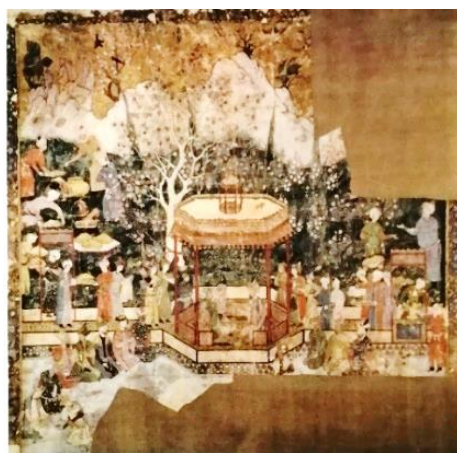
تصویر ۲. شاهزادگان سرای تیموری، نقاشی روی پارچه کتان، ابعاد ۱۲۵ × ۱۲۵ سانتی‌متر