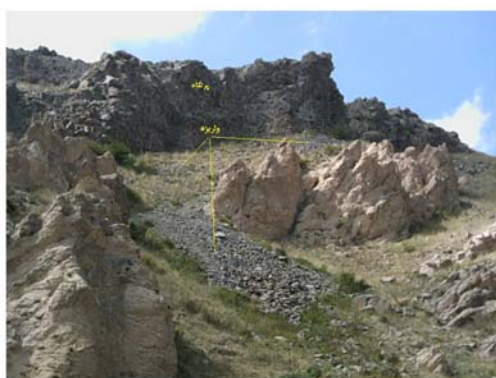
شکل ۵ پوشش واریزه در دامنه شرقی سبلان با نمای روبه جنوب منطقه سردابه. (ارتفاع ۲۰۲۰ متر)

همان‌طوری که ملاحظه می‌شود؛ هواز دگی ناشی از عملکرد یخبندان در پرتگاه‌ها، همراه با سایر فرآیندهای هواز دگی، منجر به جدایی بلوک‌ها یا قطعات سنگ شده است. این فرآیند زمانی بوجود آمده است که درجه حرارت، بعد از اینکه به مدت یک دوره زیر صفر بوده؛ سریعاً افزایش یافته و به بالای صفر درجه رسیده است. بدین ترتیب سنگ‌ها از راس دیواره‌ها به سمت پایین حرکت کرده‌اند.