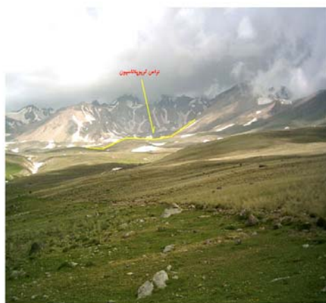
شکل ۸ تراس کریوپلاتاسیون در دامنه جنوب شرقی سبلان ( ۱۹ تیر ماه ۱۳۸۳، ارتفاع در حدود ۳۴۰۰ متر).

شکل ۸ تراس کریوپلاتاسیون ۲ (تراس هموارشده برفی) را نشان می‌دهد، که دامنه ملایمی بوده و شیب تندی بر آن مسلط می‌باشد. نیواسیون عموماً به عنوان مکانیسمی است که پسروی پرتگاه را تسریع می‌کند تا به صورت تراس یا پایکوه توسعه یابند (کلارک ۱۹۸۸).