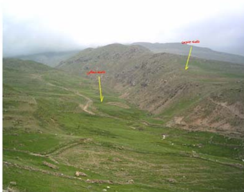
شکل ۱۱ دره نامتقارن با جهت شرقی - غربی در دامنه شرقی سیلان (دیواره سمت راست دامنه رو به جنوب و دیواره سمت چپ دامنه رو به شمال با شیب ملایم)

نمونه های متعددی از چنین دره هایی در دامنه شرقی سیلان (در ارتفاعات و در محدوده پریگلاسیر) در حال تشکیل هستند. اما از آنجا که چنین دره هایی دارای عمق کمتری هستند و چندان طویل نمی باشند، نمی توان در چنین محدوده هایی دره های نامتقارن مشخصی را معرفی نمود.