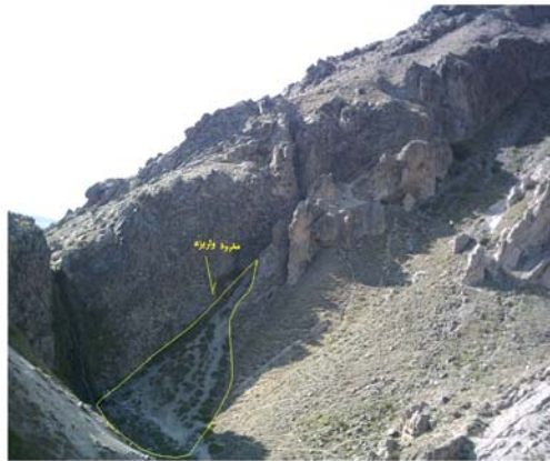
ارتفاع ۲۰۱۰ متر. (سمت چپ تصویر)

ابتدا سنگ بستر روباز به واسطه گوه‌های یخی به قسمتهای مختلف تقسیم شده و سپس خرد شده است. و چون زمانی که سنگ‌ها خرد می شوند، شکسته شده و آزاد می شوند، بنابراین نیروی ثقل موجب افتادن و معلق شدن آن‌ها به سمت پایین دامنه‌ها می شود. شکل ۶ مخروط واریزه را در دامنه شرقی سبلان نشان می دهد.