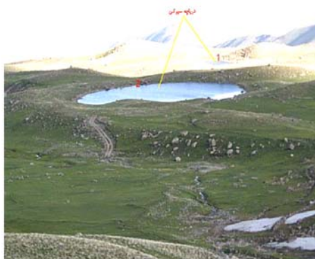
شکل ۱۰ دریاچه سیرکی ( تارن) به قطر حدود ۶۰ متر، دامنه جنوب شرقی (سیلان، ۲۳ خرداد ماه ۱۳۸۴. نمای روبه شمال و شمال شرقی).