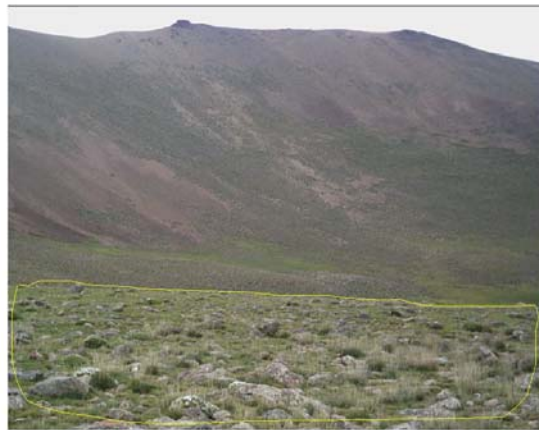
شکل ۳ پوشش گیاهی و ریگولیت، که شامل قطعات سنگی نسبتاً درشت در یک ماتریس درشت دانه است. (دامنه شرقی سبلان، قسمت مقدم تصویر).

ساختمان داخلی این سنگ‌ها، همچنین عملکرد شکستن و خورد شدن آن‌ها (ناشی از یخبندان)، فرآیند مهمی در جداسازی قطعات از سنگ بستر می‌باشد و این عوامل ویژگی‌های ریگولیت را کنترل می‌کنند.