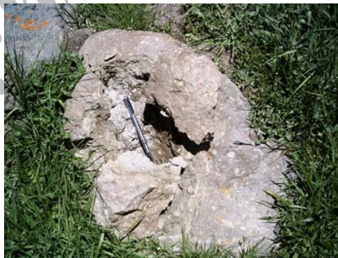
شکل ۲ تخریب مکانیکی سنگ در دامنه شرقی سبلان

علاوه بر نوسان دمای ماهانه و عملکرد یخبندان، نوسان روزانه دما نیز می تواند در هواز دگی مکانیکی دخالت نماید. اگر چه میدان عمل آن نسبت به بقیه کمتر می باشد؛ اما زمینه را برای هواز دگی مکانیکی گسترده تر آماده می کند. شکل ۲ هواز دگی مکانیکی سنگ را در دامنه شرقی سبلان نشان می دهد. در این شکل هواز دگی ناشی از نوسان دما و عمل ذوب و یخبندان کاملاً مشهود است.