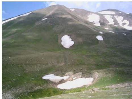
شکل ۷ تکه‌های برفی در دامنه جنوب شرقی سبلان، با نمای رو به شمال ( ۲۲ خرداد ۱۳۸۴).

پیشروی تکه‌های برفی فقط در حاشیه آنها صورت می‌گیرد و پوشش برفی بصورت محافظ مانعی برای هوازدگی فیزیکی در مرکز چاله‌ها محسوب می‌شود.