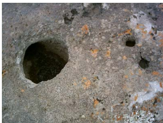
شکل ۴ تافونی در سطح سنگ، دامنه شرقی سبلان ارتفاع ۳۴۱۰ متر.

آندزیت است. خلل و فرج موجود در این سنگ‌ها، همچنین عمل خشک شدن و مرطوب شدن متوالی این سنگ‌ها بواسطه بارندگی و رطوبت هوا؛ سبب توسعه این چاله‌ها شده است.