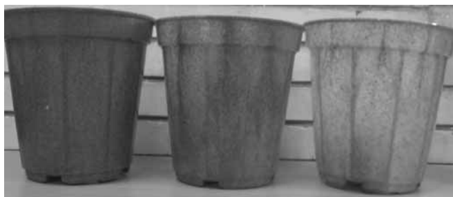
شکل ۱ - عکسی از نمونه‌های گلدان‌های تهیه شده.

براساس استاندارد ASTM D 256 با استفاده از دستگاه آزمون ضربه چارپی بدون شکاف، با استفاده از نمونه‌هایی به طول ۵۰ mm، عرض ۶ mm و ۱ mm انجام شد. برای اندازه‌گیری درصد جذب رطوبت کامپوزیت، نمونه‌هایی با ابعاد ۱۰×۱۰×۱ cm از کامپوزیت‌ها به مدت ۴۸ h در آب گذاشته و مقدار جذب رطوبت آنها اندازه‌گیری شد.