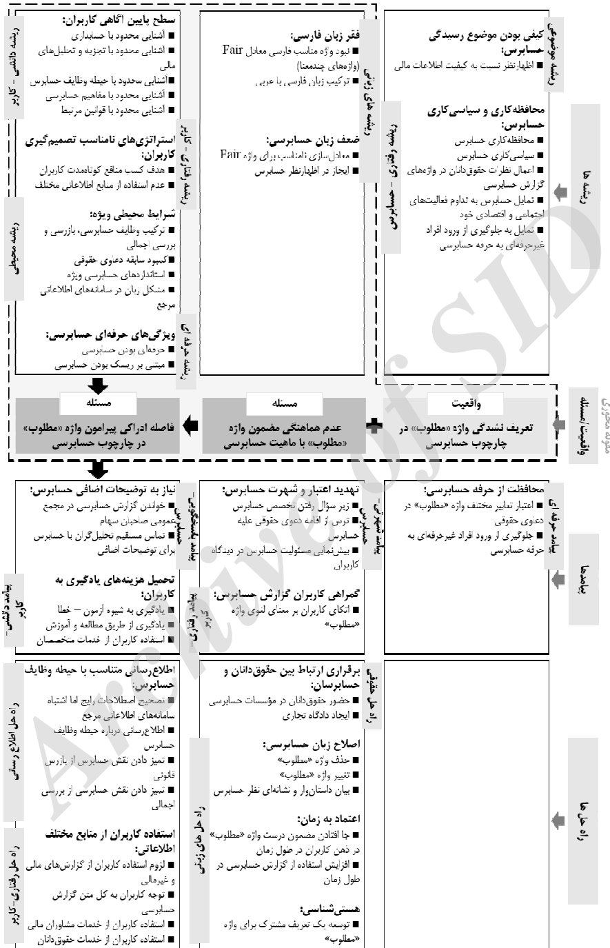
شکل ۲. مسئله‌ها و واقعیت‌ها درباره عبارت «ارائه به نحو مطلوب»