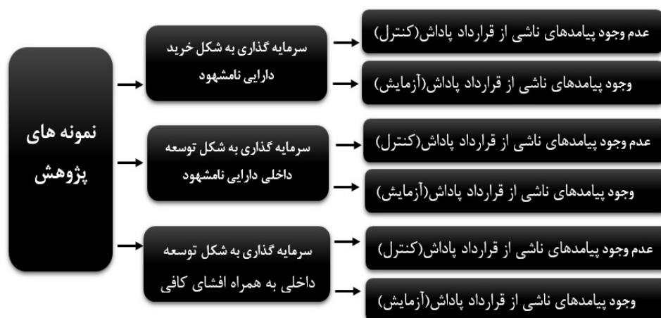
شکل ۲. گروه‌های پژوهش

نمونه اول، برای فرد تحت آزمون شرایط مصنوعی از شرکتی مطرح می‌شود که این شرکت برای توسعه خط تولید به خرید حق امتیاز تولید مواد اولیه خود اقدام می‌کند. با توجه به رویه حسابداری مربوطه برای خرید، شرکت دارایی مدنظر را در ترازنامه شناسایی و طی عمر مفید خود مستهلک می‌کند. نتایج سرمایه‌گذاری به شکل خرید طی ۵ سال آتی در صورت سود و زیان محاسبه می‌شود. نکته مهم آن است که پاداش مدیریت وابسته به صورت سود و زیان است (می‌دانیم که انتخاب سرمایه‌گذاری به شکل خرید اثر سود و زیانی نیز به همراه دارد). در نهایت از آزمون شونده درخواست می‌شود که میزان تمایل خود را در رابطه با سرمایه‌گذاری بیان کند (از مقیاس لیکرت استفاده شده است). در نمونه دوم نیز، کلیه شرایط مشابه نمونه اول است با این تفاوت که پاداش مدیریت وابسته به سود و زیان و به صورت کلی وابسته به نوع سرمایه‌گذاری انتخاب شده نیست. در سرمایه‌گذاری به شکل توسعه داخلی دارایی نامشهود نیز از همین رویه پیروی می‌شود، با این تفاوت که مخارج ناشی از هزینه‌های توسعه در صورت سود و زیان، به‌عنوان هزینه دوره شناسایی شده (اثر سود و زیانی متفاوتی نسبت به رویکرد خرید دارد) و در ترازنامه از این بابت دارایی نامشهودی لحاظ نمی‌شود. مجدداً دو حالت فرضیه پاداش نیز مشابه نمونه اشاره شده، تکرار می‌شود.