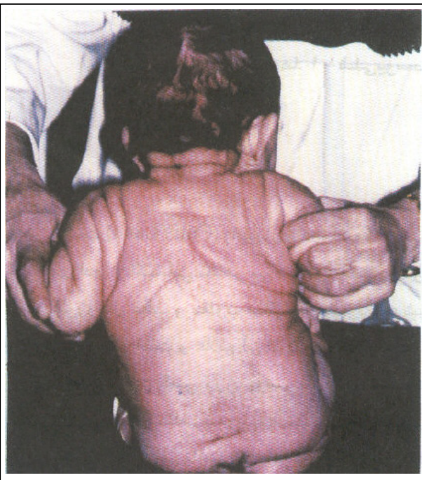
شکل شماره ۲- وجود چین‌های پوستی در قسمت پشت و بازوها قابل مشاهده است.

در شکم فتق نافی واضح و در معاینه اندامها، محدودیت حرکت در مفصل ران به صورت دو طرفه وجود داشت. در معاینه قلب و ریه‌ها نکته غیرطبیعی دیده نشد.