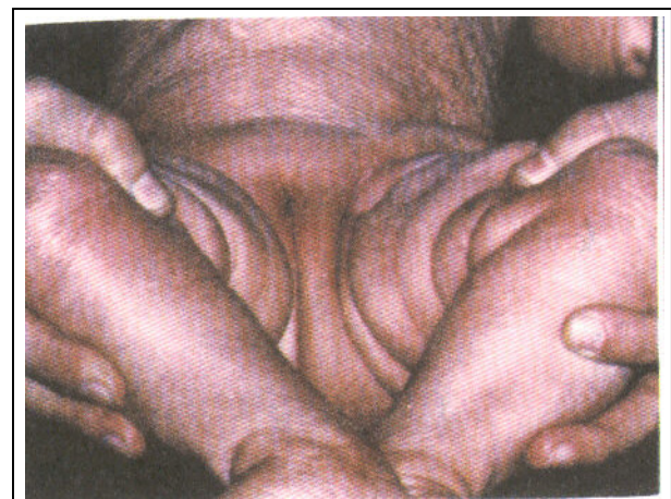
شکل شماره ۴- در این شکل محدودیت شدید حرکتی در معاینه لگن مشاهده می‌شود.