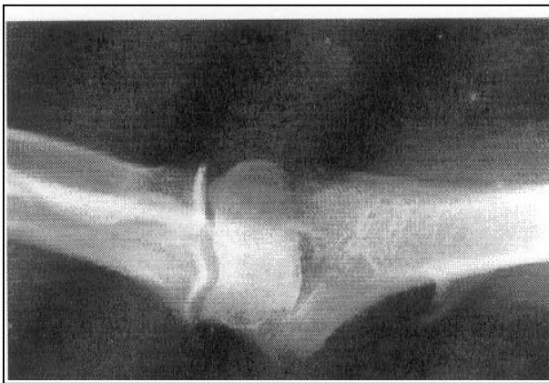
تصویر شماره ۱- رادیوگرافی خار سوپراکوندیلار

در رابطه با علائم نینز در بررسی Visual Analogue Scale درد بیمار کاهش یافته بود.