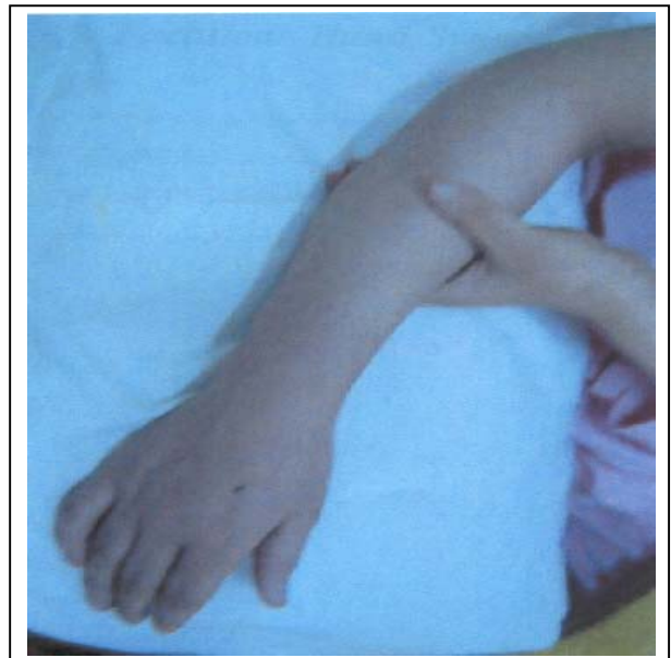
تصویر شماره ۶- بعد از برطرف شدن ادم