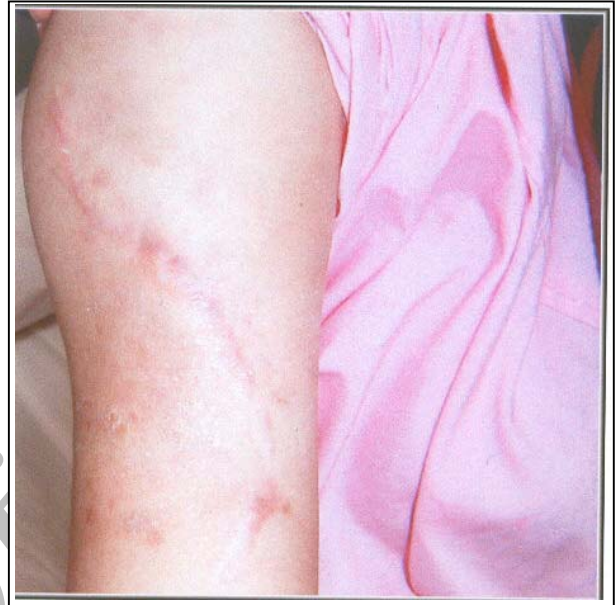
تصویر شماره ۵- دو عدد اسکار Constriction Band در پروگزیمال بازو

در مرحله بعد تصمیم گرفته شد تا مشاوره با روان‌پزشک صورت گیرد که این مسئله با مقاومت شدید همسر بیمار روبرو شد و بیمار با رضایت شخصی از بیمارستان مرخص گردید.