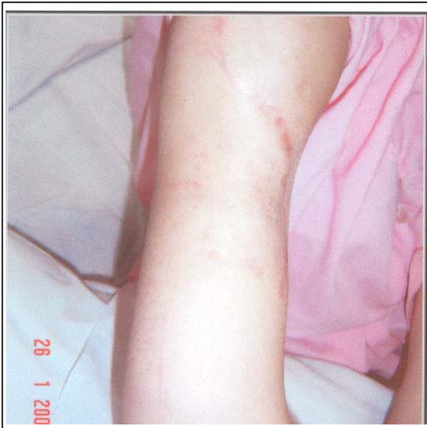
تصویر شماره ۴- ادم آرنج دیستال به اسکارهای Constriction Band

اسکارهای جراحی‌های قبلی در ساعد و بازو قابل مشاهده بود همچنین یک ناحیه آتروفیک به شکل دایره در بالای بازوی راست به شکل "Constriction band" وجود داشت (تصویر شماره ۵). ادم گوده‌گذار بود، بیمار توانایی حرکت دادن اندام فوقانی راست را نداشت و تلاش برای حرکت دادن غیرفعال (پاسیو) با درد شدید همراه بود. در معاینه، نبض‌ها و حس اندام طبیعی بود و رادیوگرافی ساده نیز طبیعی گزارش شد. در MRI، تورم بافت نرم بدون تومور مشاهده گردید و EMG، NCV، سونوگرافی داپلر شریان‌ها و وریدهای اندام فوقانی راست و نیز تست‌های آزمایشگاهی طبیعی بودند. ذکر این نکته لازم است که بیمار بستن بخش پروگزیمال اندام را انکار می‌کرد. به دنبال بستری شدن و مراقبت مداوم و بالا نگه داشتن (Elevation) اندام فوقانی راست، در عرض ۴۸ ساعت ادم کاملاً برطرف گردید (تصویر شماره ۶) سپس فیزیوتراپی به آرامی با حرکات غیرفعال (پاسیو) آغاز شد که پاسخ به فیزیوتراپی بسیار عالی بود و حرکات انگشت شست و اشاره دست راست به دنبال ۳ جلسه فیزیوتراپی بازگشت.