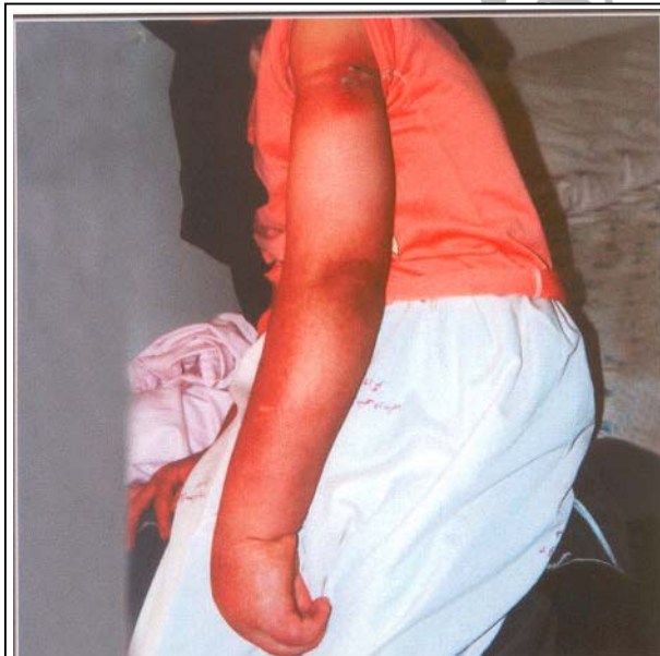
تصویر شماره ۲- وجود ۲ عدد Constriction Band در دست

سرانجام به علت سنگینی، حجم زیاد و بدون استفاده بودن (useless) اندام، آمپوتاسیون از محل مچ انجام شد (تصویر شماره ۳) که تشخیص آسیب‌شناسی Lymphangiectasis بود.