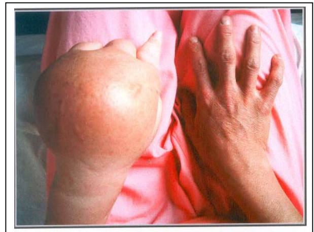
تصویر شماره ۱- ادم شدید دست بیمار

در موقع مراجعه به درمانگاه فیروزگر، در اندام فوقانی چپ در قسمت دیستال آرنج، ادم شدیدی وجود داشت که در دست بسیار شدیدتر و گوده‌گذار بود (تصویر شماره ۱).