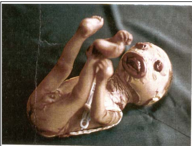
تصویر شماره ۲- نوزاد پسر، لب‌های برگشته، پلک‌های برگشته و اندام‌های دفرمه

متخصص بیماری‌های زنان پی‌گیری و مشاوره قبل از حاملگی بعدی را به والدین توصیه کرده بود اما متأسفانه اقدام خاصی در این زمینه توسط آن‌ها صورت نگرفت و مادر به طور مجدد در تاریخ ۸۰/۱۲/۲۵ با حاملگی ۳۵ هفته و ۱ روز و پارگی کیسه آب و شروع دردهای زایمانی مراجعه کرد. پس از کنترل و انجام شدن کارهای لازم، در نهایت بیمار تحت عمل سزارین قرار گرفت و نوزاد دختر با آپگار ۷ و ۸ و قد ۴۵ سانتی‌متر و وزن ۲۵۰۰ گرم که خصوصیات ظاهری آن به طور کامل مشابه نوزاد قبلی بود متولد گردید و به بخش نوزادان تحویل داده شد (تصویرهای شماره ۲ و ۴).