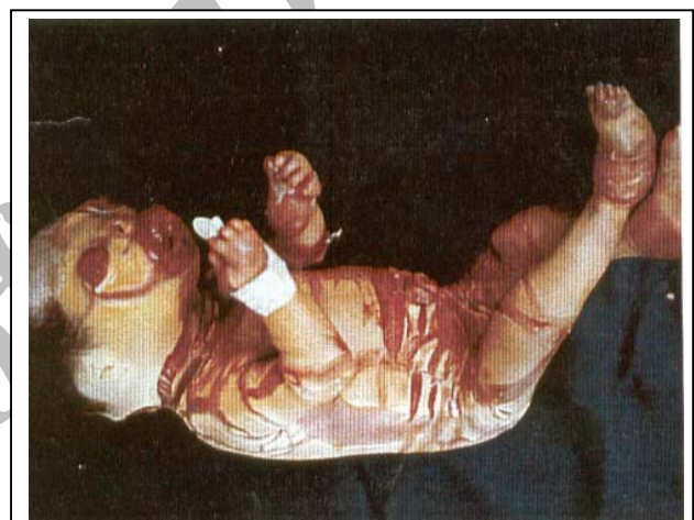
تصویر شماره ۴- نوزاد دختر، لبهای برگشته، پلکهای برگشته و انتهای آتروفیک

نوزاد داخل انکوباتور گرم و مرطوب قرار گرفت و شرایط جداسازی و استرلیزاسیون رعایت گردید. برای نوزاد، مایع، اکسیژن و آنتی‌بیوتیک لازم تجویز شد و بیوپسی از پوست نیز صورت گرفت که نتیجه آن هایپرکراتوز شدید بود. روز بعد نوزاد با تابلوی زجر تنفسی فوت کرد.