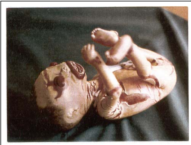
تصویر شماره ۱- نوزاد پسر با شکاف‌های عمیق پوستی