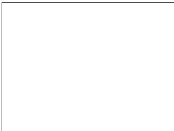
نمودار شماره ۳- پراکنش، خط رگرسیون با فاصله اطمینان 95\% وزن هنگام تولد بر حسب شاخص توده بدنی مادر