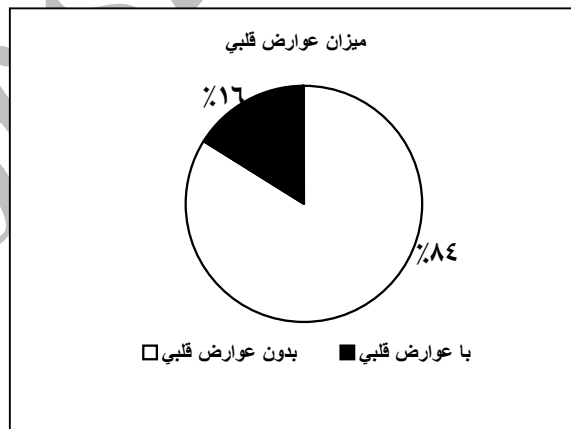
نمودار شماره ۲- جدول فراوانی مشکل قلبی در بیماران تالاسمی حامله

یک مورد آریتمی گزارش شد که بیمار Pacemaker دارد، یک مورد دیس‌فونکسیون بطن راست گزارش شده بود و بقیه علائمی از نارسایی قلبی داشتند که همگی تحت کنترل کاردیولوژیست بودند (نمودار شماره ۲). ۱۲ مورد سزارین و بقیه زایمان واژینال داشتند (نمودار شماره ۳).