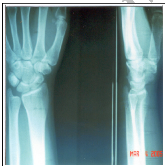
شکل شماره ۳- رادیوگرافی انجام شده ۱/۵ سال پس از ترومای اولیه