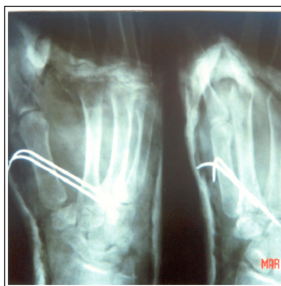
شکل شماره ۲- رادیوگرافی پس از عمل، جابجایی نسبتاً خوب هر دو شکستگی(تاریخ مربوط به زمان تهیه اسلاید است).