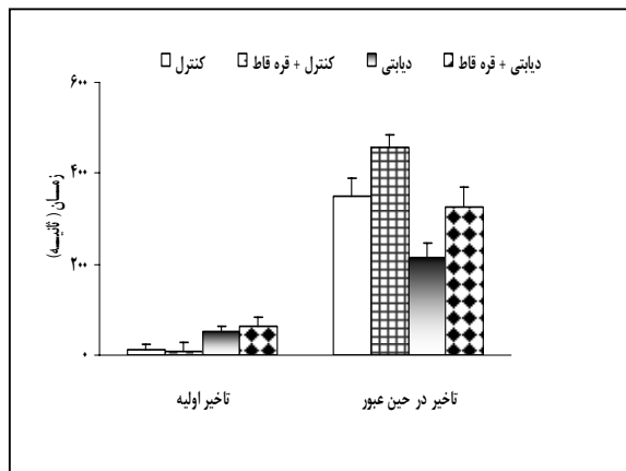
شکل شماره ۱- میزان تأخیر اولیه و تأخیر در حین عبور در آزمون اجتنابی غیرفعال در موشهای صحرایی کنترل و دیابتی تیمار شده با قره‌قاپ به صورت خوراکی پس از گذشت ۴ هفته * p < 0.05 (در مقایسه با گروه کنترل)، # p < 0.05 (در مقایسه با گروه دیابتی)

افزایش معنی‌دار در مورد تأخیر اولیه در مقایسه با گروه کنترل بدست آمد ( p < 0.05 ). بعلاوه، از نظر تأخیر اولیه هیچ گونه تفاوت معنی‌دار بین دو گروه دیابتی و دیابتی تحت تیمار مشاهده نگردید که خود به مفهوم عدم تغییر توانایی موشها در کسب اطلاعات جدید در موشهای دیابتی تحت تیمار می‌باشد. همچنین، کاهش تأخیر در حین عبور در موشهای دیابتی ( p < 0.05 ) و افزایش آن ( p < 0.05 ) در موشهای دیابتی تحت تیمار، در پایان کار بخوبی مشاهده گردید. از طرف دیگر، تیمار موشهای گروه کنترل با گیاه، تغییر معنی‌دار تأخیر در حین عبور را در مقایسه با گروه کنترل به دنبال داشت ( p < 0.05 ) (شکل شماره ۱).