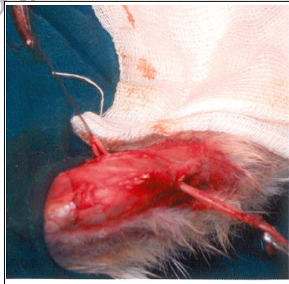
شکل شماره ۱- تاندون عضله اکستانسور بلند انگشتان از تونل پروگزیمال تیبیا در خارج از مفصل گذرانده شد.

تاندون خارج شده از تونل استخوانی توسط نخ نایلون شماره یک به صورت whipstitch دوخته شد تا بتواند به دستگاه کشش آویزان شود. با استفاده از سیستم ماشینی مزبور، تست کشش (tensile test) انجام گرفت. بدین ترتیب که تیبیا با یک گیره در دستگاه به نحوی نگه داشته شد که نیروی کشش در امتداد محور طولی تونل استخوانی، به تاندون نیرو وارد کند و تاندون توسط نخ بخیه شده به آن به قسمتی از دستگاه که نیروی کشش به آن وارد می‌کرد، متصل شد (شکل شماره ۲) و قدرت کشش تاندون (tensile tendon strength) در برابر حداکثر قدرت مقاومت ترکیب تاندون استخوان (Maximal pullout load) مورد ارزیابی قرار گرفت. تاندون با نیرویی که با سرعت ۵ میلیمتر در ثانیه افزایش می‌یافت، کشیده شد تا، یا از سوراخ استخوانی بیرون بیاید، یا تاندون از وسط پاره شود و یا تاندون از محل نخ یا اتصال به گیره پاره شود. حداکثر نیروی کشش به نیوتن در زمان پاره شدن تاندون (failure force) و محل کنده شده تاندون (failure point) در زمان پاره شدن ثبت شد و توسط یک نرم‌افزار کامپیوتری که به دستگاه وصل بود، به صورت نمودار کشیده شد.