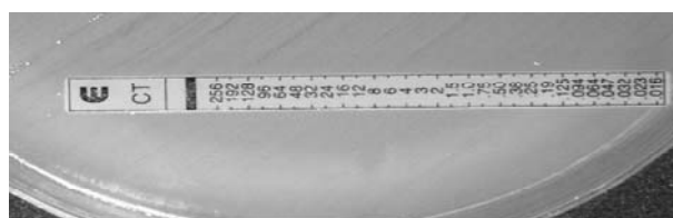
شکل شماره ۱: MIC نوار سفوتاکسیم (به مقاومت بالای ایزوله توجه کنید)

در مورد نتایج E-test، دانستن این نکته قابل توجه بود که هیچ حساسیتی در این ۴۰ ایزوله نسبت به آنتی‌بیوتیک سفوتاکسیم وجود نداشت (شکل شماره ۱)؛ یعنی غلظت آنتی‌بیوتیک در نوارهای E-test سفوتاکسیم که برابر با میزان ۲۵۶µg می‌باشد، هیچ اثر مهارکنندگی در رشد نداشت.