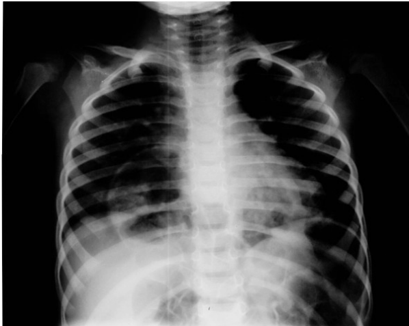
شکل شماره ۱- عکس قبل از عمل که لوپ‌های کولون در حاشیه راست قلب دیده می‌شود.

کولون به سمت شکم جا انداخته شد و نقص موجود در دیافراگم با سوچورهای نایلون ۱-۰ ترمیم شد. پس از جراحی حال عمومی بیمار خوب بوده و در طی یک سال و نیم پیگیری، بیمار بدون علامت بوده و مشکل خاصی ندارد.