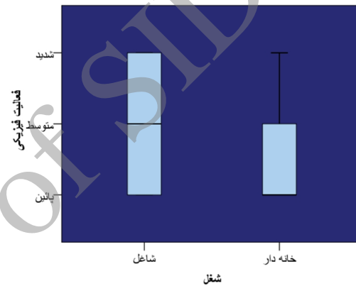
نمودار ۲- نمودار جعبه‌ای مقایسه سطوح فعالیت فیزیکی با شغل افراد مورد مطالعه

ارتباط معنی‌داری بین عملکرد و متغیرهای شغل، سطح تحصیلات و سطح تحصیلات همسران افراد دیده شد ( p=۰/۰۰۱ ). در آنالیز چند متغیره صورت گرفته با روش رگرسیون خطی، میزان تحصیلات همسران دارای اثر مستقل و معنی‌داری در عملکرد خانم‌ها بود ( p=۰/۰۰۱ ). در تجزیه و تحلیل ثانویه تحقیق حاضر مشخص شد زنان دارای تحصیلات دانشگاهی و شاغل سطح فعالیت شدیدتر داشتند. همچنین ارتباط معناداری بین سطح خودکارآمدی افراد با تحصیلات مشاهده شد. زنان با مدرک دانشگاهی خودکارآمدی بالاتری از سایرین داشتند و زنان خودکارآمدتر فعالیت فیزیکی بیشتری نیز انجام می‌دادند. در تحقیق مشابه زنان روستایی آمریکا ارتباط معنادار بین خودکارآمدی با تحصیلات و فعالیت فیزیکی مشاهده نگردید، البته شاید دلیل آن بالا بودن