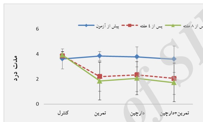
نمودار ۲- تغییرات مدت درد در گروه‌های تحقیق

مداخله‌های تحقیق مشاهده نشد (جدول ۲؛ p > 0.05 ).