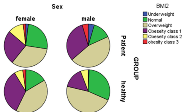
نمودار ۲- مقایسه بین بیماران دیابتی نوع ۲ با وبدون عارضه بیماری ایسکمیک قلبی بر حسب شاخص توده بدنی در میان مردان (سمت راست) و زنان (سمت چپ)

۷۳ بیمار برابر و ۲/۷٪ است (جدول ۲) ( p=0/004 ). این یافته برخلاف یافته‌های پژوهش‌های قبلی می‌باشد. چنانکه وسل در مطالعه‌ای که در سال ۲۰۰۴ انجام شد چاقی را عامل خطر فزاینده‌ی اپیدمی و قابل اصلاح برای بیماری عروق کرونر قلب ذکر می‌کند (۱۱). همین‌طور در مطالعه بنکداران و همکاران که در سال ۱۳۸۹ انجام گرفته، چاقی و اضافه‌وزن را یکی از شایع‌ترین عوامل خطر ساز قلبی عروقی در بیماران دیابتی ذکر می‌کند (۲). در مطالعه صفایی در سال ۱۳۸۱ چاقی و اضافه‌وزن، مهم‌ترین عامل خطر زای قلبی عروقی بیماران دیابتی شناخته شده است (۸). یافته‌های مطالعه حاضر بیشتر با یافته‌های مطالعات اخیر که عمدتاً در کشورهای توسعه‌یافته صورت گرفته، مطابقت دارد. نمونه آن در آسیا مطالعه‌ای است که در سال ۲۰۱۳ توسط ناگاو و همکاران در ژاپن صورت گرفت و مشخص شد شیوع بیماری‌های قلبی عروقی در بیماران غیرچاق (BMI زیر ۲۵ [در مطالعه آنان]) با چربی احشایی، مشابه بیماران چاق (BMI مساوی و بالای ۲۵) می‌باشد (۱۹). در مطالعه عمان بر روی