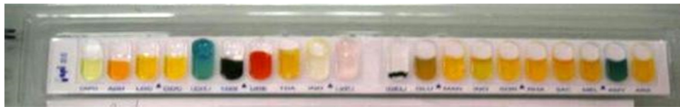
شکل ۱- کیت API-20E سیتروباکتر فروندی

از مردان و (۱/۵۷/۴۸) جدایه از زنان با میانگین سنی بیماران ۲۴ سال به دست آمد. در این بررسی درصد فراوانی جدایه های سیتروباکتر به تفکیک استان شامل استان کردستان با ۳۷ جدایه (۴۴٪)، استان یزد با ۲۰ جدایه (۲۳/۸٪)، استان سمنان با ۱۲ جدایه (۱۴/۳٪)، استان زنجان با ۱۰ جدایه (۱۱/۹٪)، استان مازندران با ۳ جدایه (۳/۶٪) و استان همدان با ۲ جدایه (۲/۴٪) می باشد (نمودار ۱). فصل تابستان با ۳۷ طغیان (۴۴٪) موارد را در بر داشته است (نمودار ۲). از ۸۴ جدایه سیتروباکتر بدست آمده از طغیان غذایی، ۲۱ مورد (۲۵٪) ناشی از آب، ۴۳ مورد (۵۱/۲٪) ناشی از غذا و ۲۰ مورد (۲۳/۸٪) نامشخص بوده است. از بین جدایه ها ۳۰ مورد (۳۵/۷٪) از منابع روستایی و ۵۴ مورد (۶۴/۳٪) از منابع شهری جدا شده است.