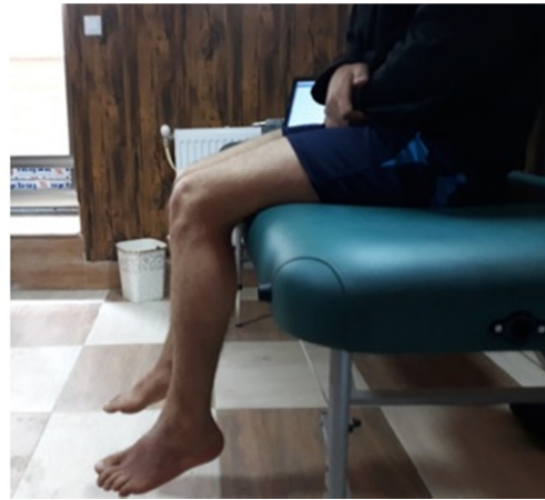
شکل ۱- نحوه نشستن برای ارزیابی حس وضعیت مفصل زانو

روی دیوار کنار فرد مورد مطالعه علامت گذاری می‌شد تا آزمونگر بتواند پای آزمودنی را تا محدوده‌ی مورد نظر بالا ببرد. اگرچه در این روش ممکن است زاویه آزمون مورد نظر دقیقاً توسط آزمونگر به طور غیر فعال ساخته نشود ولی به پیشنهاد استیلمن (۲۱)، از آنجا که فرد همان زاویه‌ای را که به او نشان داده می‌شود را بازسازی می‌کند، از این نظر اختلالی در نتایج آزمون ایجاد نمی‌گردد. پس از آن زانو توسط آزمونگر به وضعیت استراحت (۹۰ درجه فلکشن) برگردانده می‌شد. سپس آزمودنی زاویه مورد نظر را با همان اندام به صورت فعال، بدون استفاده از بینایی و فقط با اتکا به حس عمقی بازسازی می‌کرد. مقدار خطای فرد در بازسازی زاویه هدف به عنوان خطای حس وضعیت مفصل ثبت می‌شد. در این مطالعه زاویه ۴۵ درجه به عنوان زاویه هدف برای بازسازی انتخاب شد (۲۵). زمان استراحت بین آزمون یک دقیقه است. آزمون برای هر آزمودنی سه بار تکرار و میانگین خطای بازسازی طی سه بار اندازه‌گیری، خطای بازسازی زاویه برای آن زاویه در نظر گرفته می‌شد.