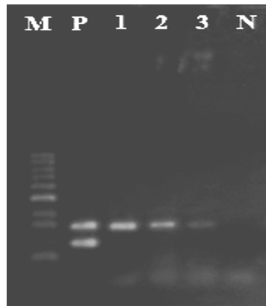
شکل ۳- الکتروفورز حاصل از Duplex PCR ژن cpa و cpe M مارکر مولکولی ۱۰۰bp، P جدایه کلوستریدیوم پرفرنزنس ۱۰۶۱۵۷ و cpa و cpe N کنترل منفی (فاقد DNA ژنومی)، ۱-۳ جدایه‌های کلوستریدیوم پرفرنزنس جدا شده از سبزیجات خشک و cpa (324bp) و فاقد ژن cpe (233bp)

علی‌رغم نبود آب در سبزیجات خشک برخی از باکتری‌ها به خصوص اسپوردارها قادر به رشد و تکثیر در سبزیجات می‌باشند. مطالعات زیادی در مورد جداسازی، تیپ بندی و بررسی ژن‌های مختلف توکسین‌های کلوستریدیوم پرفرنزنس در سراسر جهان انجام شده است، اما در مورد مواد غذایی و خصوصاً سبزیجات خشک مطالعات محدودی صورت گرفته است. سبزیجات خشک به روش‌های مختلفی استفاده می‌شوند و آلودگی میکروبی این سبزیجات احتمالاً می‌تواند بیماری ایجاد نماید، به خصوص اگر در پایان پخت به غذا اضافه شوند یا روی غذا بدون پخت و حرارت اضافه شوند. به خاطر زنده ماندن اسپور در حرارت ناکافی و ماندن غذا در دمای اتاق به مدت