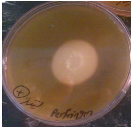
شکل ۲- کلستریدیوم پرفرنژنس لسیتیناز مثبت روی محیط Egg yolk agar

کلستریدیوم پرفرنژنس در سبزیجات خشک از نظر ژن آنروتوکسین ( cpe ) می‌باشد.