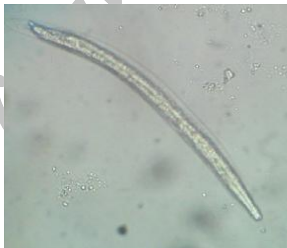
شکل ۲: مرحله سوم لاروهای عفونی‌زای نماتودی جدا شده از سبزیجات مزارع اطراف اهواز