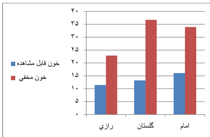
نمودار 1: مقایسه توزیع فراوانی خون قابل مشاهده و مخفی روی وسایل بیهوشی و مانیتورینگ در بیمارستان‌های مختلف