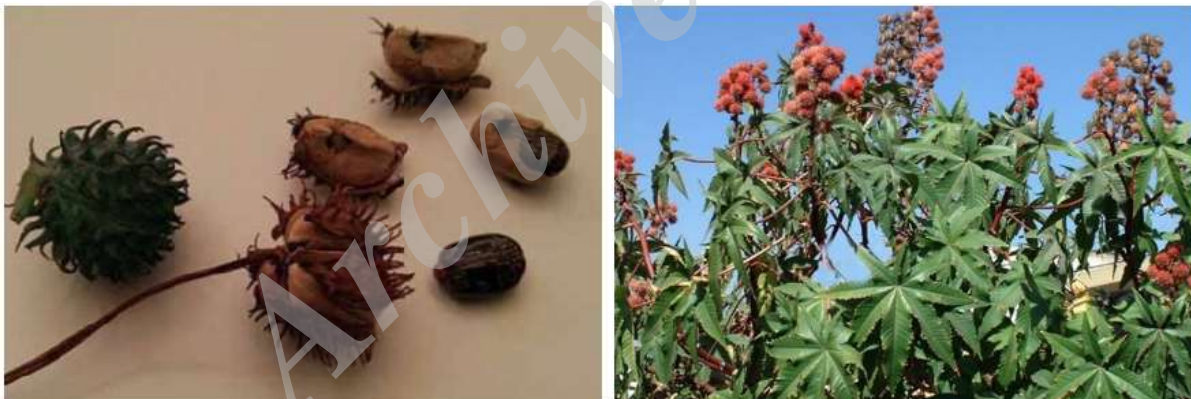
تصویر ۱: تصویر گیاه کرچک و دانه گیاه کرچک در حال خارج شدن از پوسته اولیه

اولین سمی که به شبکه اندوپلاسمی می‌رسد باید به واسطه غشاء شبکه اندوپلاسمی به درون سیتوزول منتقل شود تا بتواند سمیت خود را اعمال کند. درون شبکه اندوپلاسمی ریسین احیاء می‌شود و زنجیره A از زنجیره B جدا می‌شود. زنجیره A سپس از تاخوردگی خارج می‌شود و از غشاء شبکه اندوپلاسمی عبور می‌کند و وارد سیتوزول می‌شود. زنجیره A باید از مسیرهای تخریبی وابسته به شبکه اندوپلاسمی اجتناب کند، تا زمانیکه در جریان پروتئینی ترانس لوکون‌ها که بخشی از مسیر تخریب هستند بکار برود. اینکار به واسطه استفاده از چاپرون‌هایی مانند Hsc70 و Hsp90 انجام می‌شود، بعلاوه یک تغییر ساختار وابسته به دما در زنجیره A انجام می‌شود و باعث کاهش ساختارهای مارپیچ آلفا