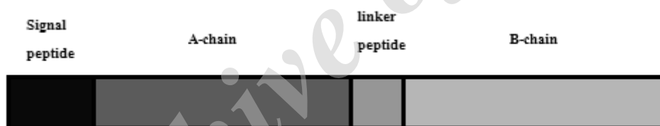
تصویر ۳: ساختمان شماتیک mRNA کدکننده Preproricin: حاوی سیگنال پپتید، دو زنجیره A، B و پپتید متصل کننده