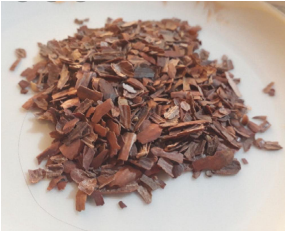
مجله علمی پزشکی جندی شاپور