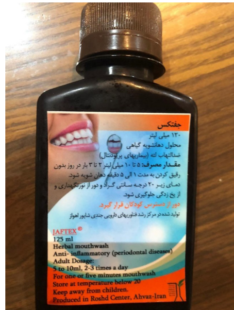
تصویر ۴. دهانشویه جفتکس جندی شاپور

گیاهان دارویی به واسطه اثرات ضد میکروبی‌شان نقش حیاتی در درمان بیماری‌ها ایفا می‌کنند. امروزه تقاضا برای دهانشویه‌های گیاهی افزایش یافته است، چراکه علیه پاتوژن‌های دهانی عمل می‌کنند و در عین حال درد را نیز سریعاً بهبود می‌بخشند [۵۹]. از آنجا که دانش بشری به سمت استفاده از داروهای گیاهی سوق پیدا کرده است، یافتن خواص مختلف گیاهان، به‌ویژه گیاهان بومی در هر کشور و ناحیه می‌تواند به پیشرفت هرچه بیشتر دانش کمک کند. بر اساس یافته‌های این مطالعه خاصیت ضدباکتریایی دهانشویه جفتکس تا حد زیادی به عصاره جفت بستگی دارد. استفاده از جفتکس به عنوان یک دهانشویه گیاهی جدید با اثر آنتی‌باکتریال و ضد پلاک به بیماران توصیه