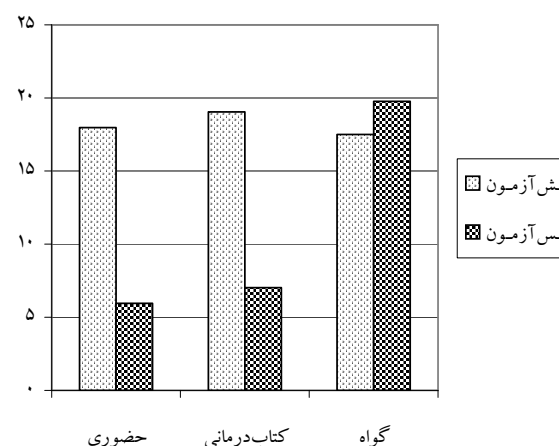
نمودار ۲- مقایسه نمره‌های افسردگی گروه‌های درمان و گواه در پیش‌آزمون و پس‌آزمون