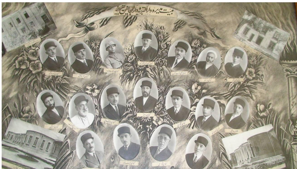
شکل ۲- هیئت مدیره دارالتربیه و دارالمجانین تبریز