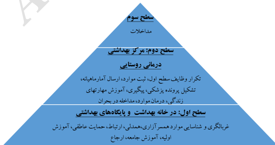
شکل ۲- خلاصه مدل پیشگیری از همسرآزاری در مدل مراقبت‌های بهداشتی اولیه ایران و ادغام بهداشت روان

برای ارائه طرح خدمات پیشگیری از همسرآزاری در نظام خدمات بهداشتی ایران، مدلی مبتنی بر این نظام و نظام ادغام یافته بهداشت روان در مراقبت‌های بهداشتی اولیه (۷۴) - که تاریخچه و توسعه آن شرح داده شد- به شرح زیر و با رعایت ویژگی‌های نظام مراقبت‌های بهداشتی اولیه در ایران طراحی شد. ویژگی‌های مدل «پیشگیری از همسرآزاری در مراقبت‌های بهداشتی اولیه» (شکل ۲)، همان ویژگی‌های نظام مراقبت‌های بهداشتی و بهداشت روانی ایران است که عبارتند از: سطح‌بندی خدمات؛ غربالگری و شناسایی موارد همسرآزاری؛ پاسخ‌گویی به نیازهای اولیه بهداشتی، بهداشت روانی و مراقبت از قربانیان همسرآزاری؛ ارجاع موارد به سطوح بالاتر در صورت نیاز به خدمات تخصصی‌تر؛ بازخورد از سطوح بالاتر؛ جامعیت خدمات (که خود شامل پیشگیری