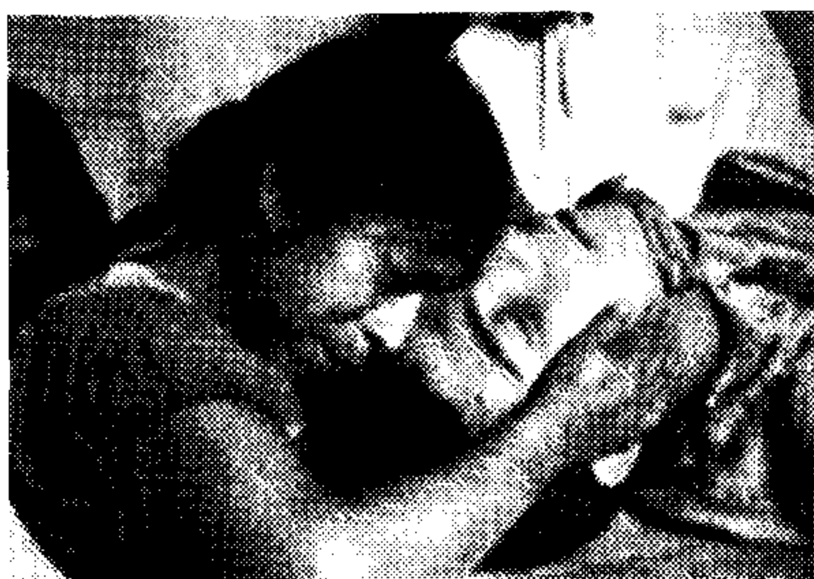
(تصویر ۵) مطالعه عکاسی برای تصویر کارگر مقتول (هنر نمایشی در مکزیک).

سیکیه روس از شیوه های مختلف کلاسیک تا باروک و رمانتیسم در ارایه این نقاشی استفاده کرده است و به نوعی آثار رابرت راشنبرگ ۳ ، که دارای جنبه های خشن و پیچیده می باشد و نیز نقاشی های خوان جنووس ۴ که در آنها پیکره های زیادی در حال دویدن یا بدون نظم در حال پروازند را تداعی می کند. به هر حال این نقاشی، نیروی خلاقیت سیکیه روس را به سمت رشته ای جدید از نقاشی دیواری با فکرهای ابتکاری، شکل ها و مواد، ابزار و محتوای زیبایی شناسی که تماماً از ذهن خلاق وی نشأت می گرفت سوق داد.