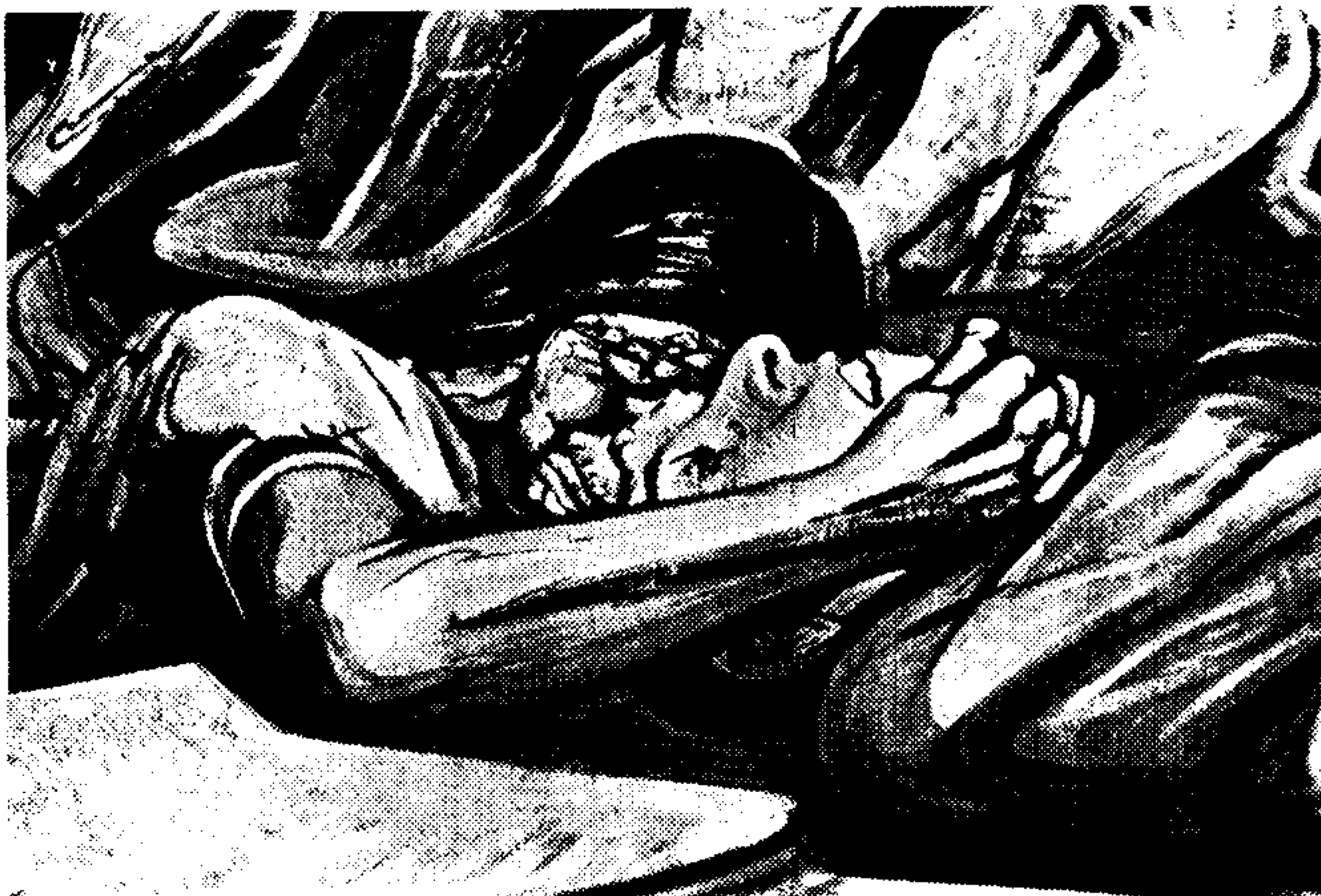
(تصویر ۴) هنر نمایشی در مکزیک (جزیی از نقاشی)، سیکیه روس، آکرولیک روی چوب، ۱۹۵۹، مکزیکوسیتی.