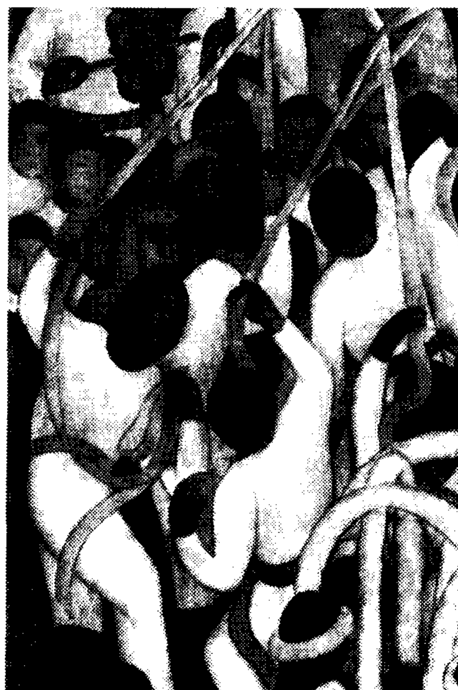
(تصویر ۲) رقص ریبون (جزیی از تصویر)، فرسک، ۴-۱۹۲۳

هنگامی که اوبره گون به پایان دوره چهارساله تصدی ریاستش نزدیک می شد، مشکلات سیاسی ناشی از تغییرات