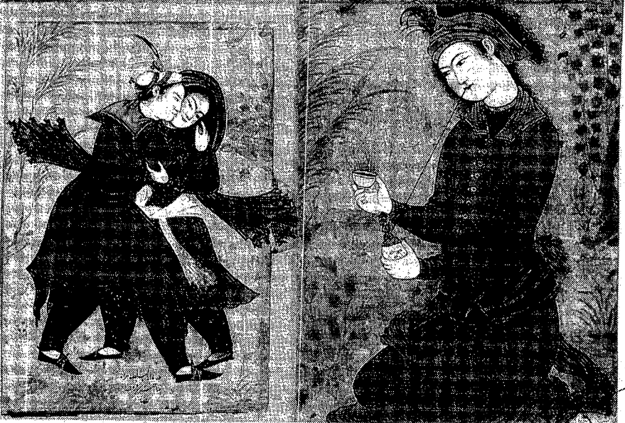
دودلداده، اصفهان، ۱۰۲۸-۱۰۱۸، کار رضا عباسی، کتابخانه ملی روسیه، سن پترزبورگ