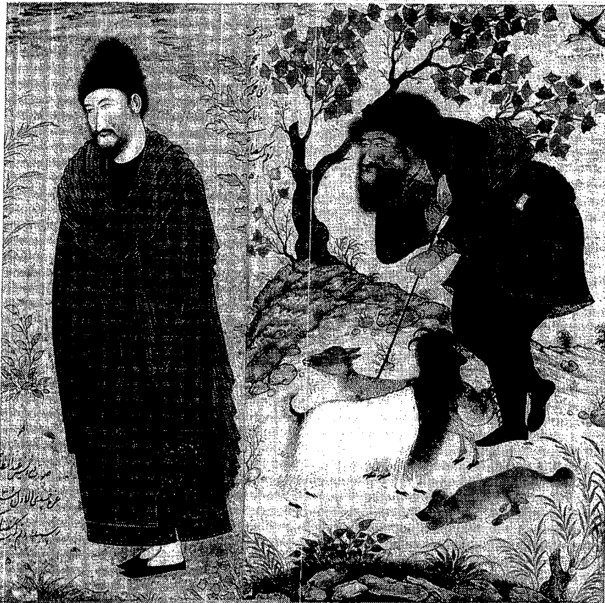
چوپان، اصفهان، ۱۰۴۲، کار رضا عباسی، کتابخانه ملی روسیه، سن پترزبورگ