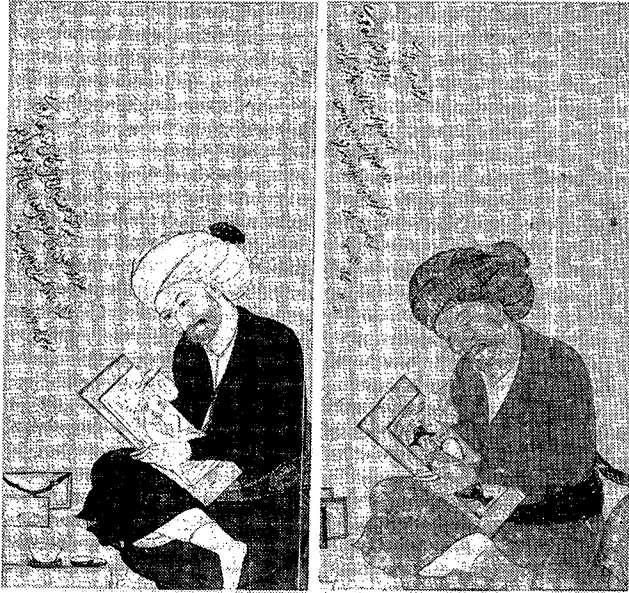
تصویر ۲- بزرگنمایی: رضا عباسی در حال نقاشی، به امضای معین مصور، اصفهان، ۱۰۸۷ هجری، اندازه تصویر ۱۱×۱۹ سانتی متر، مجموعه گارت (۹۶ جی)، کتابخانه‌های دانشگاه پرینستون.

استادم رضا عباسی مشهور به رضا عباسی اصغر به تاریخ شهر شوال با اقبال سنه ۱۰۴۴ آبرنگ گردیده بود که در شهر ذوقعه الحرام شهر مذکور از دارفنا به عالم بقا رحلت نمود و این شبیه بعد از چهل سال در چهاردهم شهر رمضان المبارک سنه ۱۰۸۴ حسب القرموده فرزندی محمد نصیرا به اتمام رسانید. معین مصور غفر عنه ذنوبه" (Ibid).