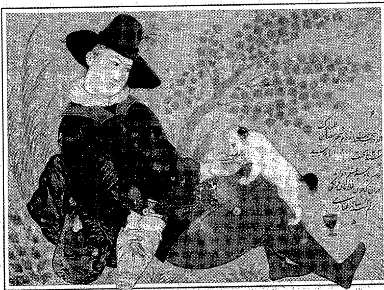
تصویر ۸- پیکره فرنگی، رضا عباسی

و چوپانان و درویشان و درباریان می توان آثار از پرندگان و تقلیدهایی از آثار بهزاد و محمدی را مشاهده کرد. او در پیکره ای که در سال ۱۰۲۸ هجری، از یک نفر فرنگی می کشد طنز و جد را درهم می آمیزد. در این نگاره، فرنگی در حال میگساری است و از جام شراب خود به سگش شراب می نوشاند (تصویر ۸). با اینکه شاگردان رضا در سرتاسر سده یازدهم هجری همچنان پی سپار سبک نگارگری او بودند ولی آنها از نظر پیچیدگی و ظرافت پیکره ها و طرز قلم گیری و خط پردازی هرگز به پای او نرسیدند.