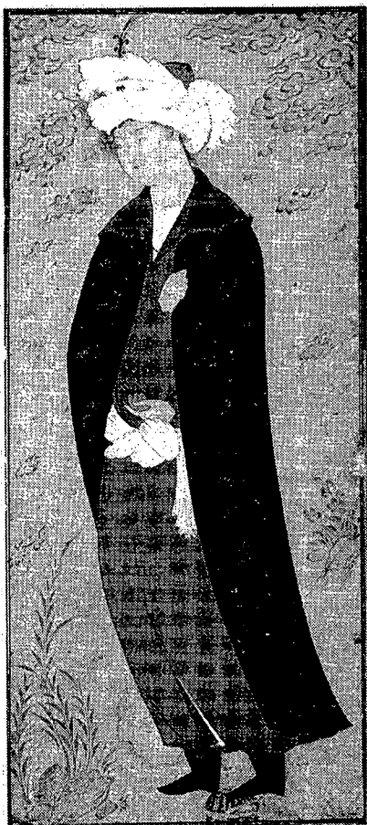
تصویر ۲- مرد جوان باردای آبی، ۹۹۳ هجری، کار رضاعباسی، موزه آرتور سکلر، موزه‌های هنری دانشگاه هاروارد، کمبریج (از آثار نخستین رضا عباسی با بازنمایی دقیق یکی از ملازمان درباری)

در این مقام با اینکه هنوز جوان است ولی به تعبیر قاضی احمد "همگی استادان و مصوران نادره زمان او را به استادی و مهارت" می‌پذیرند و چیرگی قلم او تأیید می‌کنند. دوره دوم، دوره میانسالی اوست که از دربار و صحبت "ارباب استعداد" کناره می‌گیرد و به قول اسکندر بیک منشی با هرزه‌دران و کشتی‌گیران و به تعبیر قاضی احمد با نامرادان و لوندان و به تعبیر واله اصفهانی با کشتی‌گیران و قلندران همنشین و هم‌صحبت می‌شود و زندگی آزاد سرو صوفی‌واری در پیش می‌گیرد و این طرز زندگی او در آثارش حضوری ملموس پیدا می‌کند. در این دوره زندگی درباری با مزاج و تنگ‌حوصلگی او سازگار نمی‌افتد از این رو سلوک عارفانه پیشه می‌کند و با لایه‌های پایین جامعه اخت می‌شود و در آثارش به بازآفرینی زندگی و کیفیت حیات اجتماعی این لایه‌های جامعه اصفهان می‌پردازد. پیداست که تحولات و دگرگونی‌های اجتماعی و اقتصادی شاه عباس چندان با ذوق و طبع او سازگاری نداشته‌است. او و دربار همدیگر را تحمل نمی‌کنند.