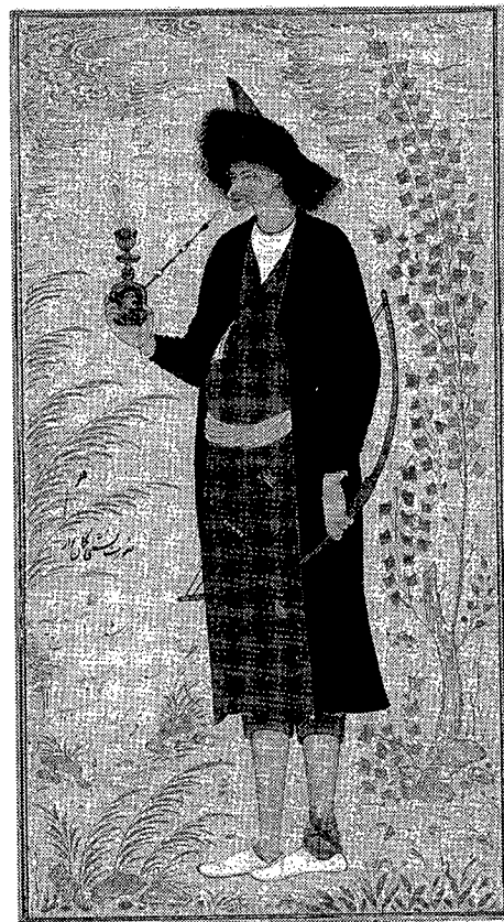
تصویر ۶- نشمی کماندار، کار رضا عباسی، موزه آرتور سکلر، موزه های هنری دانشگاه هاروارد، کمبریج (تصویری سنجیده از سربازی تریاکی که بیشتر به کاریکاتور می ماند تا نقاشی. به تصویر کله کشیش فرانسوی در بدنه قلیان دقت شود)