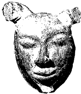
تصویر ۳ - صورتک نمایشی از مهنجودارو