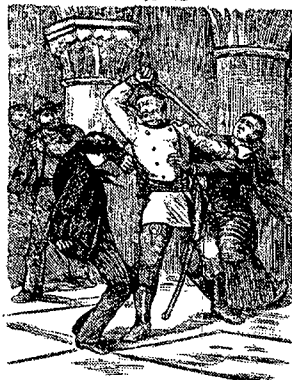
مُعَلِّمِ بَدْرْمَشْتِ تصویر ۷- نسخه کنت مونت کریستو، ۱۳۲۲ هـ. ق، تهران، چاپ سنگی

معمولاً تصویرسازی این نوع کتاب ها، به صورت کپی برداری از تصاویر نسخه اصلی صورت