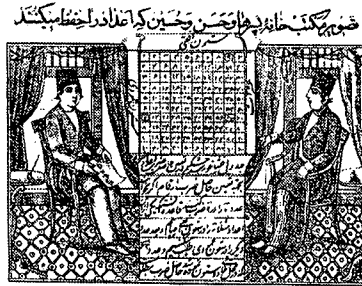
تصویر ۸ - نسخه الف و بای مفتاح الملک، ۱۳۰۳ هـ. ق، تهران، چاپ سنگی

پرهیز از عمق‌نمایی طبیعت‌گرایانه در تصاویر کتب چاپ سنگی، وفاداری به ارزش‌های تصویری و تجسمی سنت‌های هنر تصویری ایران را در آنها نشان می‌دهد. قرارگیری هر پیکره در مقابل پیکره‌ای دیگر، به طوری که قسمتی از پیکره زیرین را می‌پوشاند، حس پلان بندی و جلو و عقب بودن را منتقل