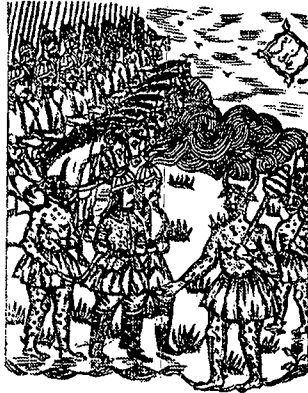
تصویر ۶- نسخه امیرارسلان، ۱۳۱۷ هـ. ق، تهران، چاپ سنگی

و تصویرگر با تکرار خطوط و پیکره های سوار بر اسب بر تحرک و پویایی تصاویر کمک کرده است (تصویر ۶).