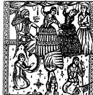
تصویر ۵- نسخه هزارویکشب، ۱۲۷۲ هـ. ق، چاپ سنگی

مجموعه قصه های هزارویک شب که باشگرد قصه درقصه نوشته شده است، یکی از پیچیده ترین متن های ادبی به شمار می آید. از این نسخه بین سال های ۱۲۷۲ هـ. ق تا ۱۳۲۰ هـ. ق دست کم هفت نسخه مصور منتشر شده است (Marzolph, 2001, P.25). این کتاب از زمان قاجار به بعد توسط مصوران مختلف و با شیوه های گوناگون تصویرسازی شده است. یکی از این نسخه ها چاپ سال ۱۲۷۲ هـ. ق است و تصویرگران میرزا رضاتبریزی است. نسخه دیگری که به شیوه چاپ سنگی منتشر شده، بدون تاریخ است و تصاویر آن امضای میرزا حسین اصفهانی را دارد (محمدی - قائینی، ۱۳۸۱، ص ۱۱۴). تصویرگر در این اثر چهره های زنان و مردان را کاملاً قاجاری طراحی کرده و بابالو پایین قراردادادن