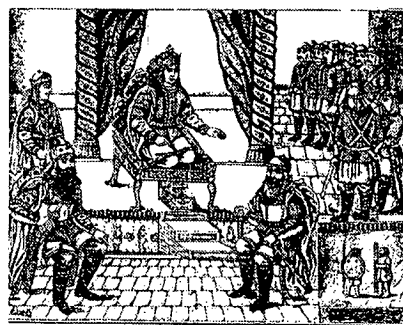
تصویر ۲ - نسخه شاهنامه فردوسی مشهور به شاهنامه امیربهداد، ۱۳۲۲ تا ۱۳۲۶ ه.ق، تهران، چاپ سنگی

امیربهداد جنگ تهیه و چاپ شد، شاهنامه معروف به امیربهداد و به قطع سلطانی است. ساخت این شاهنامه تقریباً چهار سال یعنی میان سال های ۱۳۲۲ تا ۱۳۲۶ ه.ق به طول انجامید. به همین جهت به تصویرهای مظفرالدین شاه و محمدعلی شاه مزین است و در انتهای کتاب تصویری از امیربهداد آمده است. این نسخه شش ستونی و مصور است. همچنین به خط خوشنویس معروف، عمادالکتاب مزین شده است (افشار، ۲۵۳۵، ص ۱۴) (تصویر ۲).