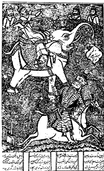
تصویر ۱- نسخه شاهنامه فردوسی، ۱۲۶۵ ه.ق، تهران

اولین نسخه‌های چاپ سنگی شاهنامه در هندوستان در سال‌های ۱۲۶۲ ه.ق و ۱۲۶۶ ه.ق به چاپ رسیدند. همچنین اولین شاهنامه به همین شیوه در محرم سال ۶۷ - ۱۲۶۵ ه.ق در تهران به خط نستعلیق و قطع رحلی در ۵۹۵ ورق چاپ شد (تصویر ۱) (افشار، ۲۵۳۵، صص ۷-۱۳). اشعار این شاهنامه در چهار ستون نوشته شده و مصور است و تصویرگر آن علیقلی خوئی است. با بررسی تصاویر این دو نسخه پی‌می‌بریم که تصویرسازی نسخه‌های چاپ سنگی ایران در ابتدا تحت تأثیر تصاویر نسخه‌های چاپ شده در هندوستان بوده است.