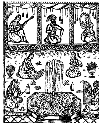
تصویر ۹ - نسخه هزارو یکشب، ۱۲۷۲ هـ. ق، تهران، چاپ سنگی

در ترکیب بندی مجالس به انرژی بصری عناصر کمتر توجه شده است. به همین دلیل، هر جای فضای تصویر که خالی مانده با