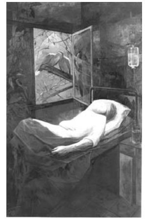
ایرج اسکندری ۱