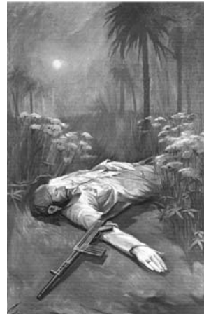
ایرج اسکندری ۲