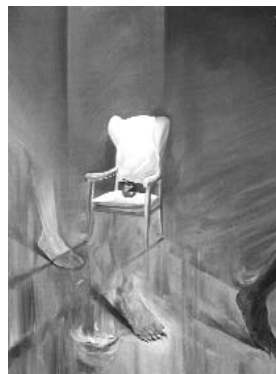
حبیب الله صادقی ۵