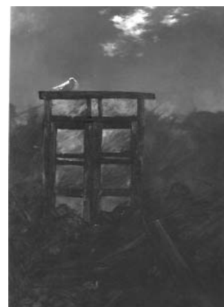
مصطفی گودرزی ۲