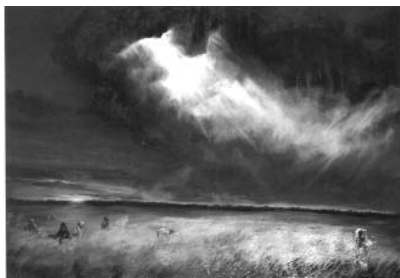
حمید قدیریان ۱