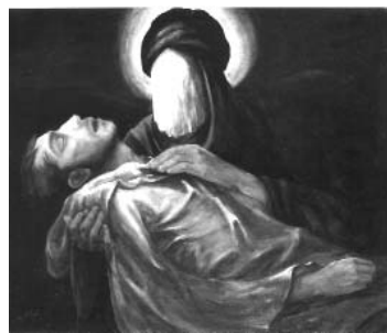
حمید قدیریان ۴