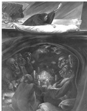
کازم چلیپا ۴