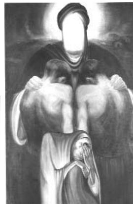
کازم چلیپا ۲