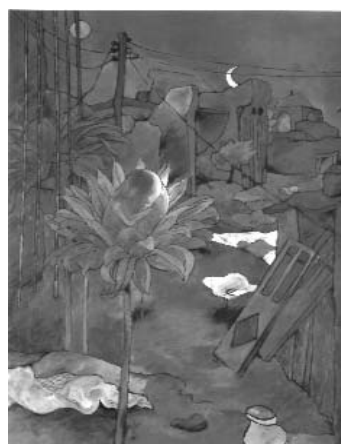
مصطفی گودرزی ۳