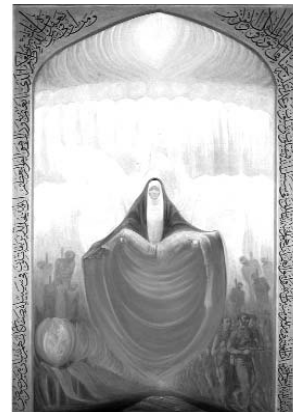
کازم چلیپا ۱