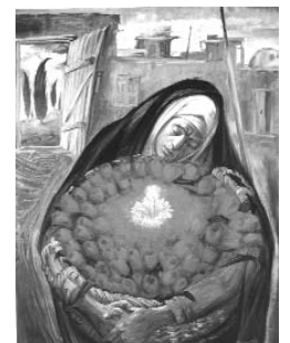
کازم چلیپا ۵