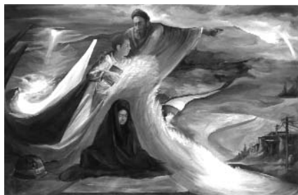
حمید قدیریان ۲