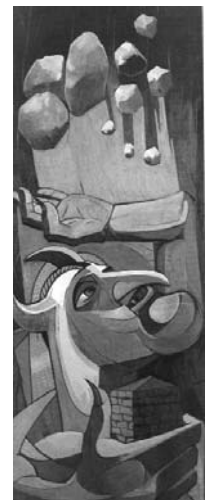
ایرج اسکندری ۵