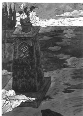
مصطفی گودرزی ۵