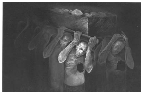
حبیب الله صادقی ۲