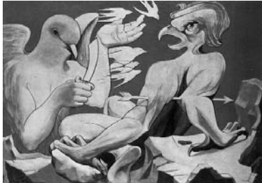
ایرج اسکندری ۳