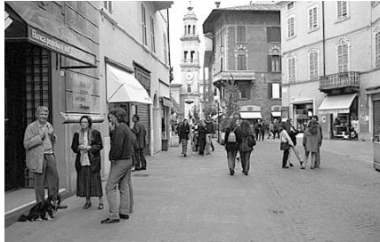
تصویر شماره ۱: رویکرد دوباره دنیا به سوی شهرهای پیاده

اجرای فضاهای عمومی به خصوص خیابان به عنوان یکی از عناصر اصلی فضای شهری از دید صاحب نظران، استفاده کنندگان و سرویس دهندگان در طول تاریخ، کاربرد و عملکرد خیابان به عنوان یک فضای عمومی، حرکت و جایگاه عابر پیاده در نظام حمل و نقل کنونی، دیدگاه‌های مختلف اثرگذار در طراحی شهری در زمینه جابجایی، شناخت و دسته بندی پارامترهای موثر بر حرکت عابر پیاده بر اساس اسناد طرح‌های جامع پیاده در ۱۴ شهر آمریکا و اروپا پرداخته و سپس با مقایسه اهداف، نیازها و ضوابط مشترک در شهرهای مورد مطالعه در جهت افزایش کیفیت فیزیکی محیط، با در نظر گرفتن معیارهای فرهنگی و اجتماعی- بومی به ارائه شاخص هایی در جهت ارزیابی موضوع میزان قابلیت پیاده‌مداری در محیط مورد مطالعه پرداخته خواهد شد.