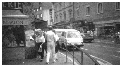
تصاویر ۶ و ۷: ایجاد تعادل بین ماشین و عابر پیاده