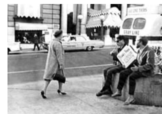
تصاویر شماره ۴ و ۵: تفاوت‌های استفاده از خیابان در جوامع شهری