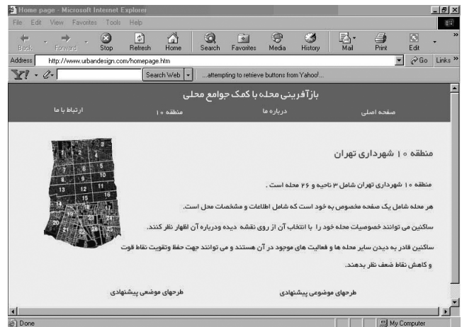
شکل ۳- صفحه اصلی وب سایت باز آفرینی محله های منطقه ۱۰

شکل ۴- محله شماره ۳ منطقه ۱۰ (سلسبیل شمالی). علاوه بر اطلاعات اولیه درباره محله، از طریق دکمه های پایین این صفحه، اتصال به صفحات بعدی میسر می شود. این صفحات شامل اطلاعات مربوط به نقاط قوت، ضعف، امکانات و موانعی که بر سر راه توسعه محله به صورت بالقوه یا بالفعل از دید اهالی محله می تواند وجود داشته باشد، می گردد. علاوه بر آن، صفحه مربوط به جلسات محلی اعم از صورت جلسات قبلی و تاریخ جلسات بعدی نیز قابل دسترسی می باشد.